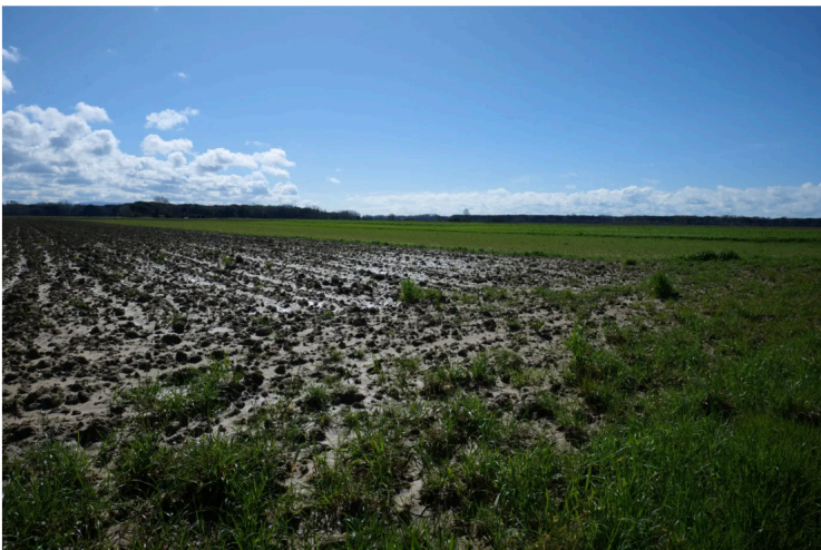
la prova di lungo periodo MASCOT (confronto tra sistemi culturali biologici e convenzionali)