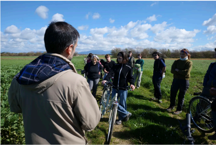
la prova di lungo periodo MASCOT (confronto tra sistemi culturali biologici e convenzionali)