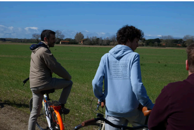
Terza tappa: la prova di lungo periodo MASCOOT (confronto tra sistemi colturali biologici e convenzionali)