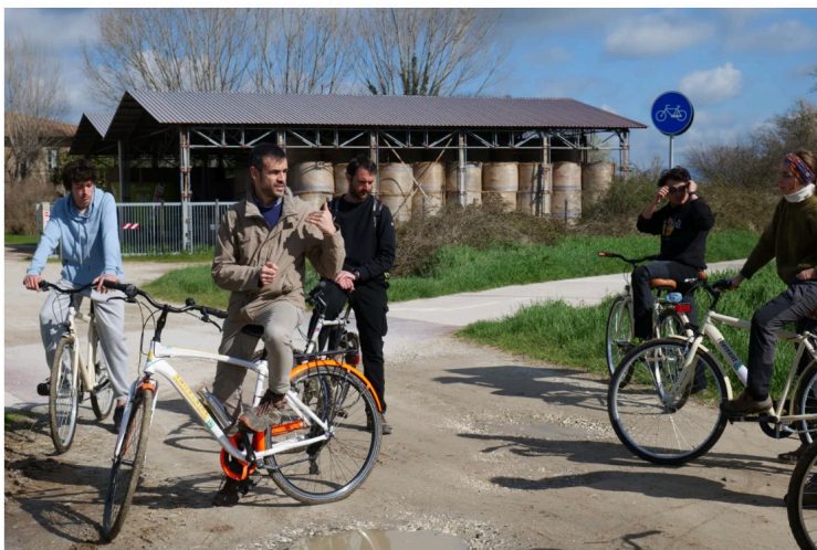
Prima sosta: il centro zootecnico del CIRAA