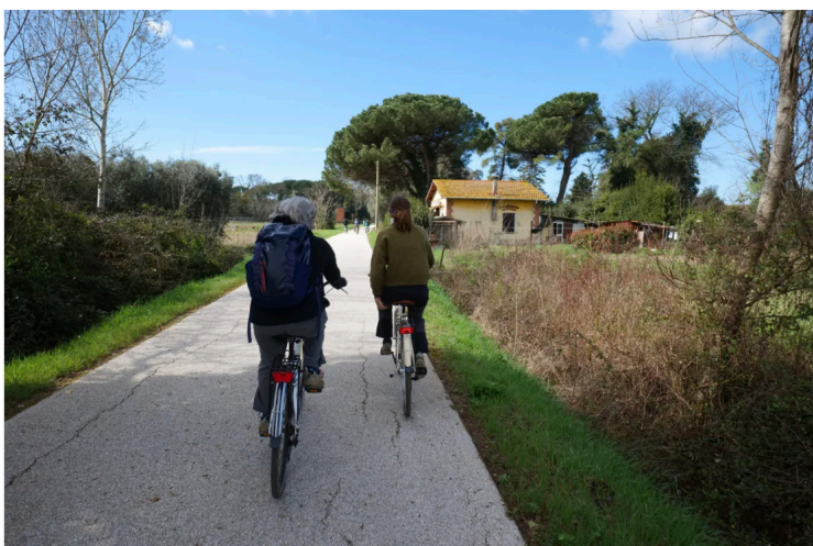
Continuiamo il nostro percorso sulla pista ciclo-pedonale del trammino