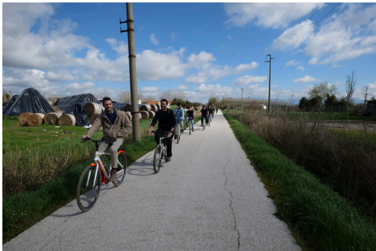
La carovana di biciclette alla scoperta della tenuta di Tombolo.