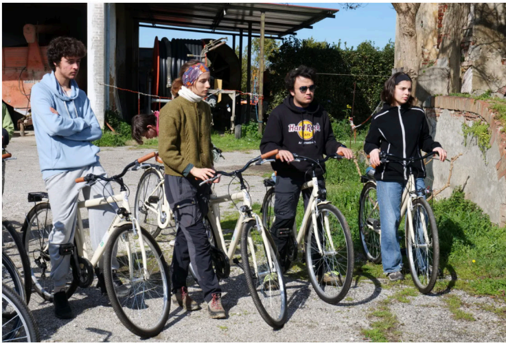
La classe dimostra grande curiosità di iniziare questa avventura.