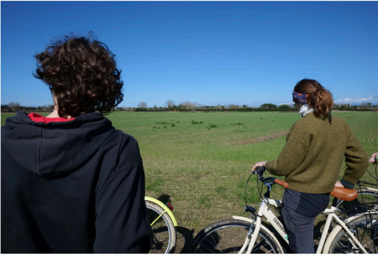
la prova di lungo periodo MASCOT (confronto tra sistemi culturali biologici e convenzionali)