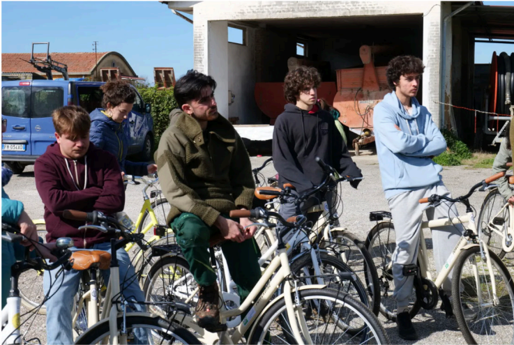
La classe dimostra grande curiosità di iniziare questa avventura.