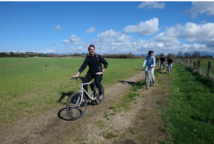
Continuiamo il percorso nella pista ciclopedonale dell'Università di Pisa