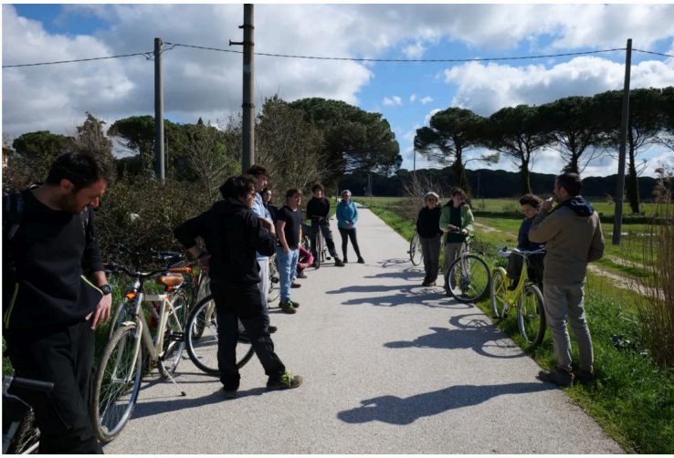
Seconda tappa: l'area dedicata alle prove sperimentali di lungo periodo