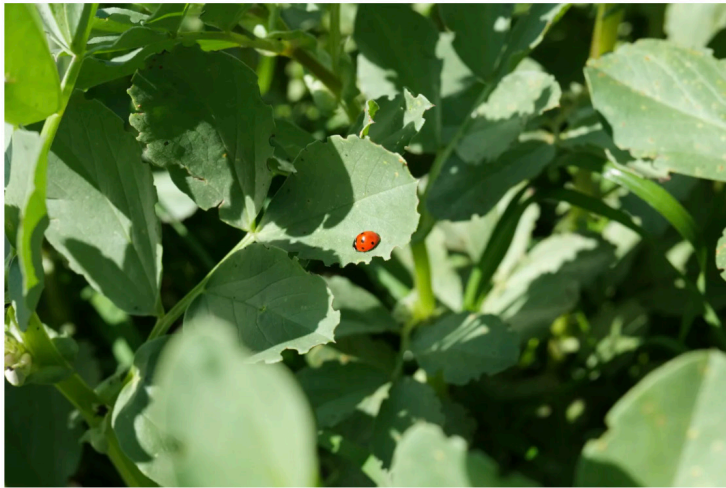
Una coccinella sulle piante di favino.