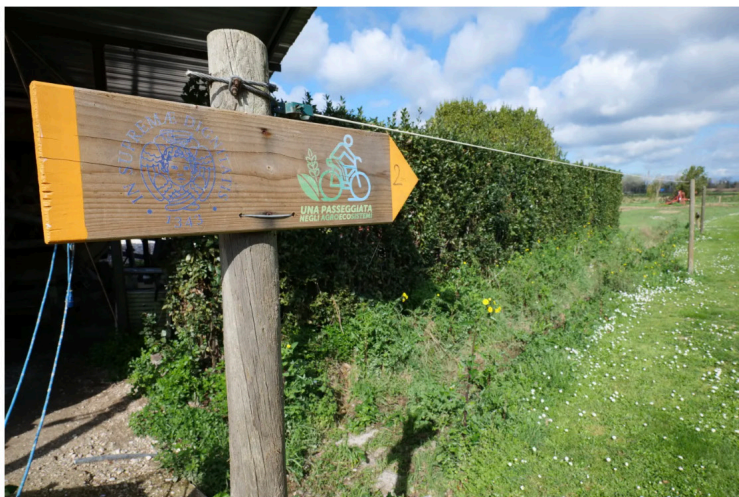
Inizio del percorso.