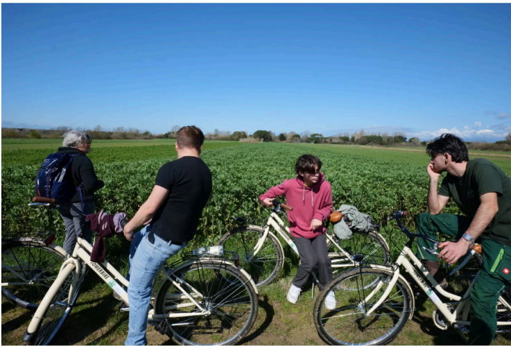
Il gruppo di fronte ad una parcella di favino da sovescio