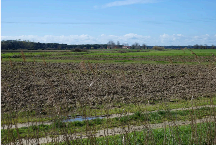
Seconda tappa: l'area dedicata alle prove sperimentali di lungo periodo